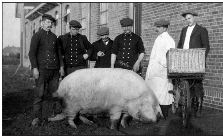
Werknemers naast het Zevenaarse slachthuis.

J. L. GANS & ZONEN, Zevenaar vragen Commissiekoopers voor Londensche varkens tegen scherp concurrerende prijzen. Wekelijks te ontvangen te Zelhem, Terborg, Varseeveld en Winterswijk. 7046